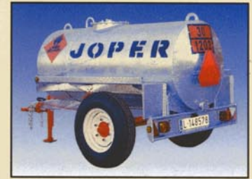
TG - 1000